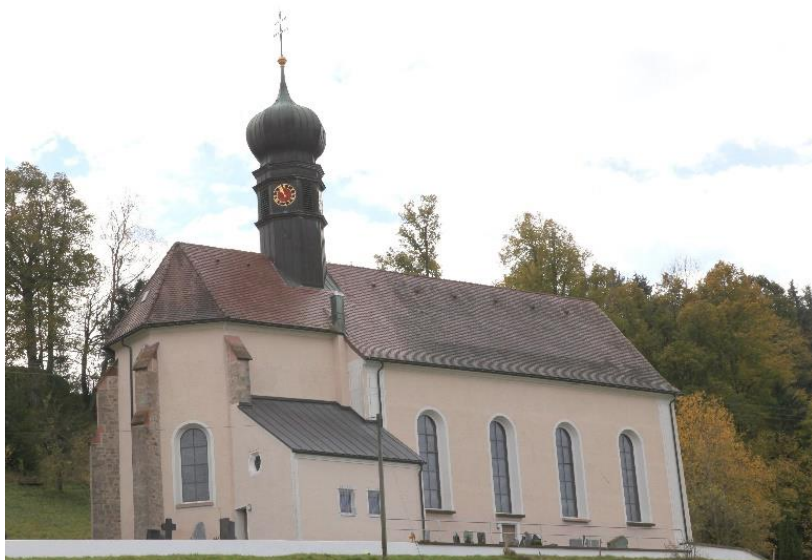
St. Maria Gündelwangen