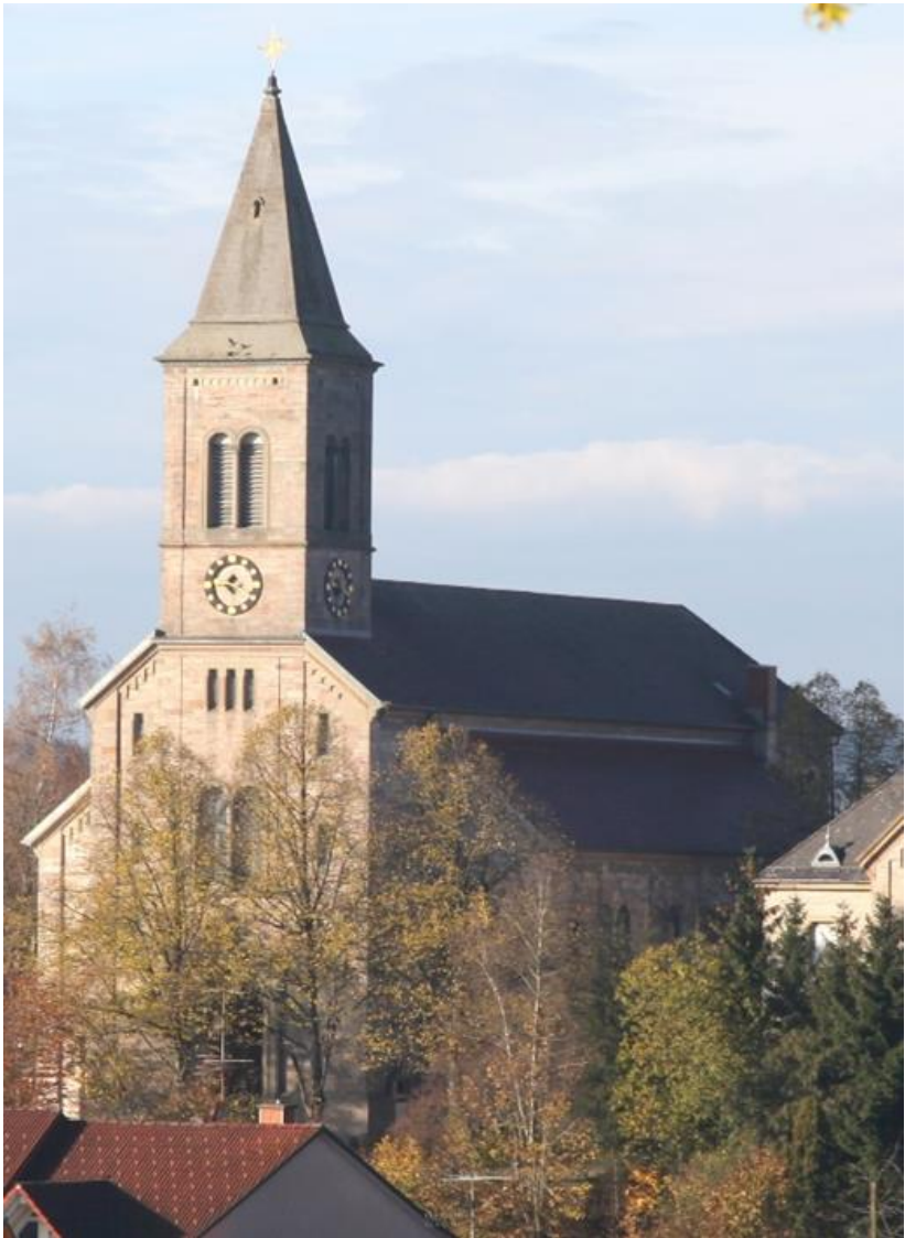
St. Peter und Paul Bonndorf