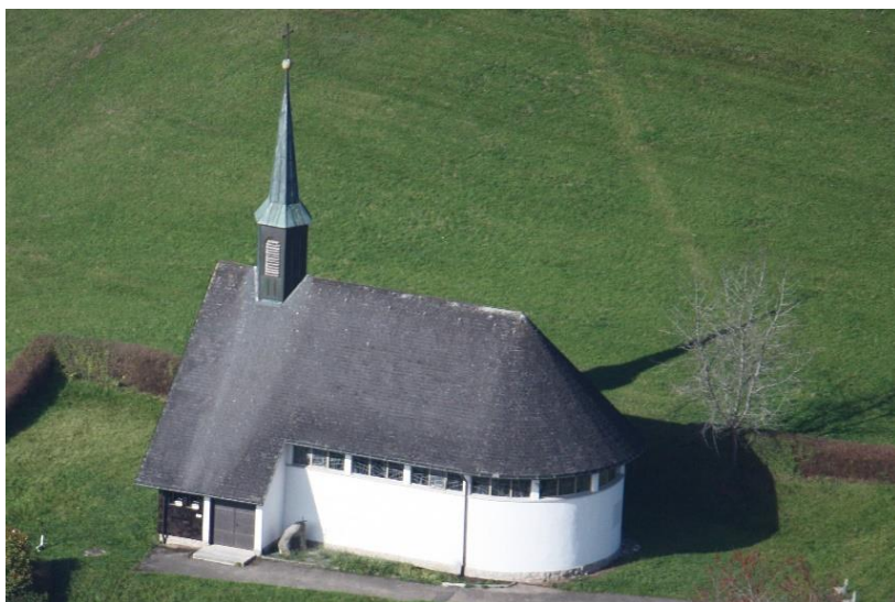
St. Anna Ebnet